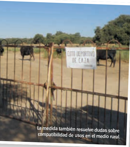
La medida también resuelve dudas sobre compatibilidad de usos en el medio rural.

“aumenta la competitividad y la rentabilidad, reduce el impacto ambiental, diversifica la producción y contribuye a un mayor y mejor uso de las tecnologías de la información y la comunicación (TIC)”.