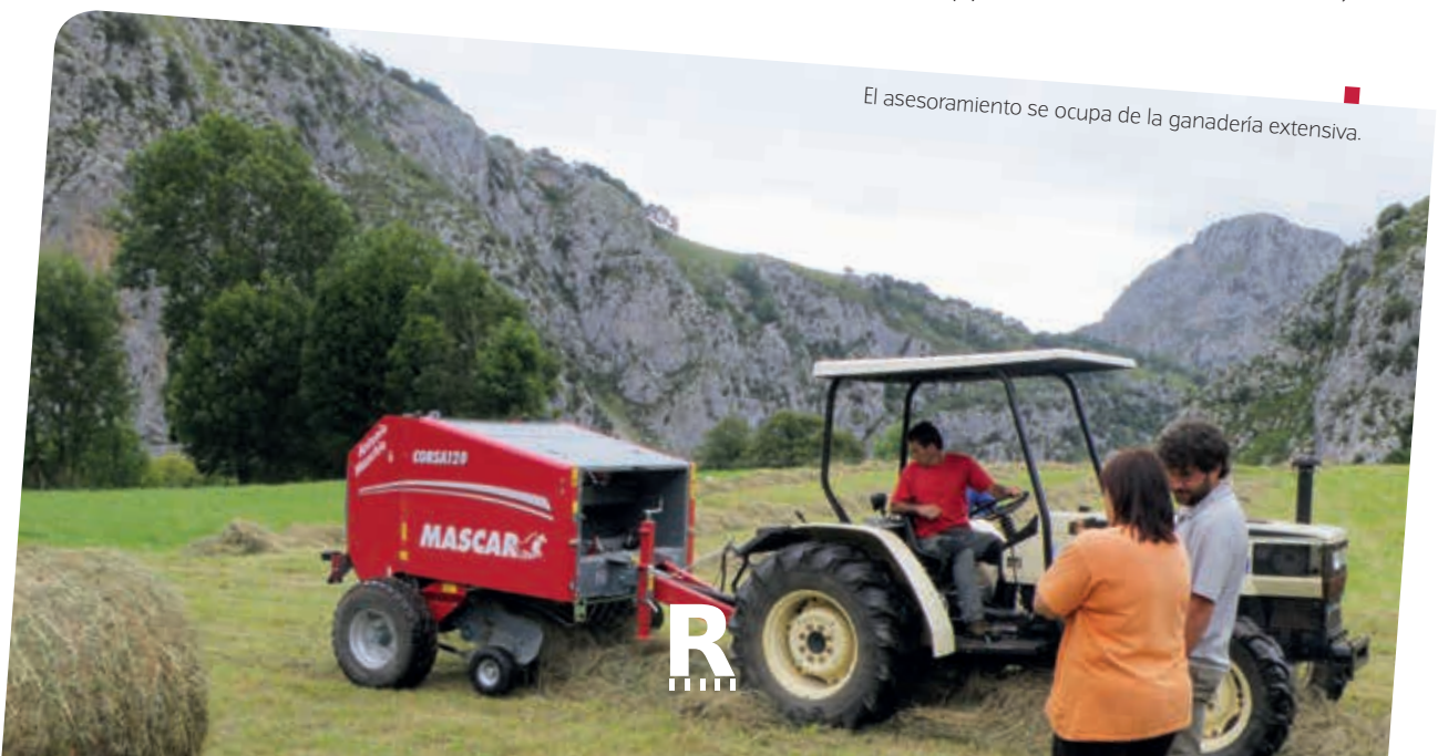
El asesoramiento se ocupa de la ganadería extensiva.

El objetivo es ayudar a los agricultores, especialmente a los jóvenes y de nueva incorporación, a titulares forestales, a otros gestores de tierras y a las pymes de zonas rurales a mejorar la