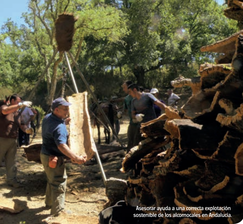
Asesorar ayuda a una correcta explotación sostenible de los alcornoques en Andalucía.