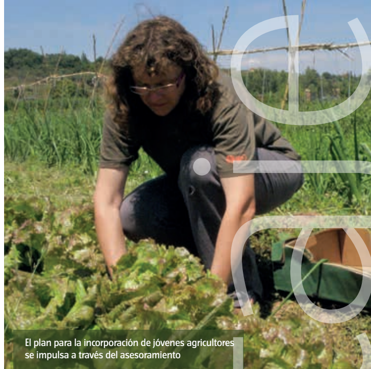
El plan para la incorporación de jóvenes agricultores se impulsa a través del asesoramiento

gestión sostenible y el rendimiento global de sus explotaciones o empresas. La primera novedad es que la medida actual (M2) unifica las dos anteriores contempladas en la programación 2007-2013: utilización de servicios de asesoramiento (M114) e implantación de servicios de sustitución, gestión y asesoramiento (M115).