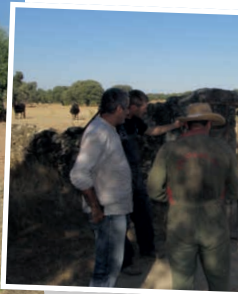
Otros grandes ecosistemas, como los olivares de Castilla-La Mancha, requieren de servicios de asesoramiento.